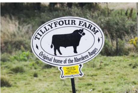
Home of Aberdeen Angus. Tillyfour Farm regnes som oppavsstedet til rasen.