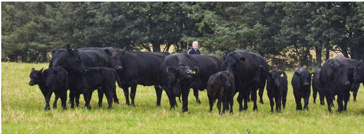
Neil framhever at Aberdeen Angus har et godt lynne og er lette å håndtere. Godt voksne bønder som vil ha dyr som er lettere å ha med å gjøre trekkes fram som en årsak til at rasen er i framgang i Skottland.

litt over 18 måneder. For Angus er det normale at kastrerte okser slaktes 20–22 måneder gamle. Da har de en slaktevekt på rundt 400–420 kilo. Kvigene slaktes ved 18–20 måneders alder og slaktevekt på 350–380 kilo. Mens «ung okse» slaktes ved 13–15 måneders alder og slaktevekt på 420–440 kilo. «Ung okse» føres intensivt med mye kraftfôr, mens kastrater